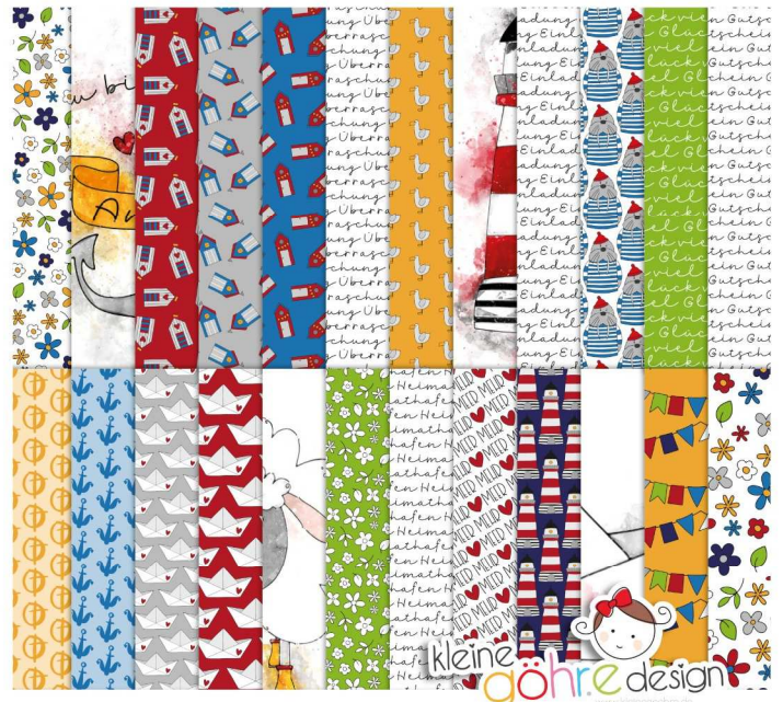
digitale Papiere "Meerweh Muster2"