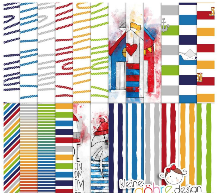
digitale Papiere "Meerweh Streifen&Co"