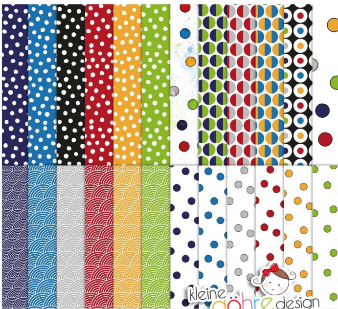
digitale Papiere "Meerweh Punkte&Co"