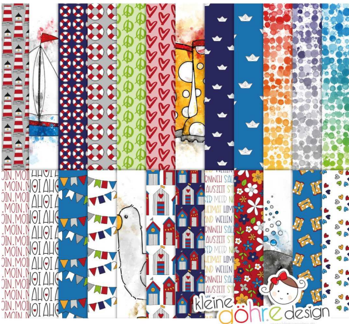
digitale Papiere "Meerweh Muster1"