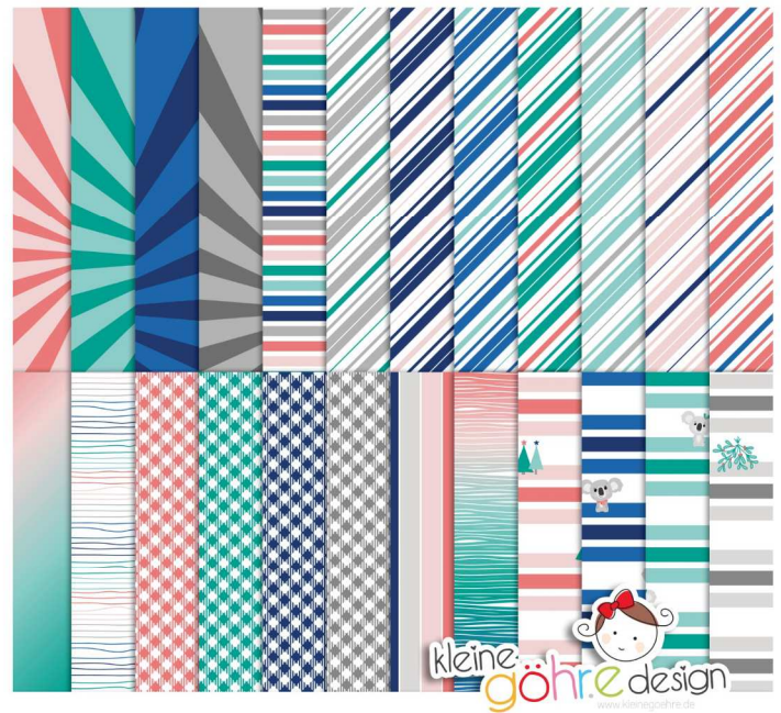
digitale Papiere "Kuschelige Weihnacht Streifen&Co"