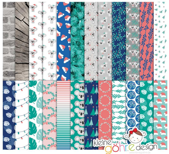
digitale Papiere "Kuschelige Weihnacht Muster 2"