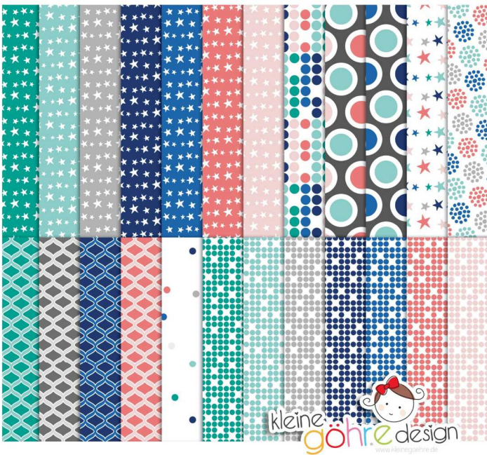
digitale Papiere "Kuschelige Weihnacht Sterne&Co"