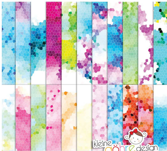
digitale Papiere "Mosaik Farbexplosion Zarter Muster4"