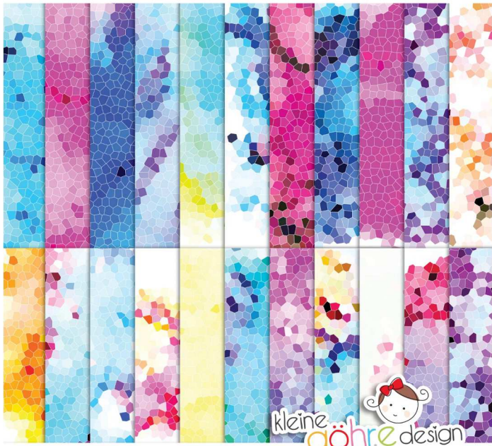
digitale Papiere "Mosaik Farbexplosion Zarter Muster1"