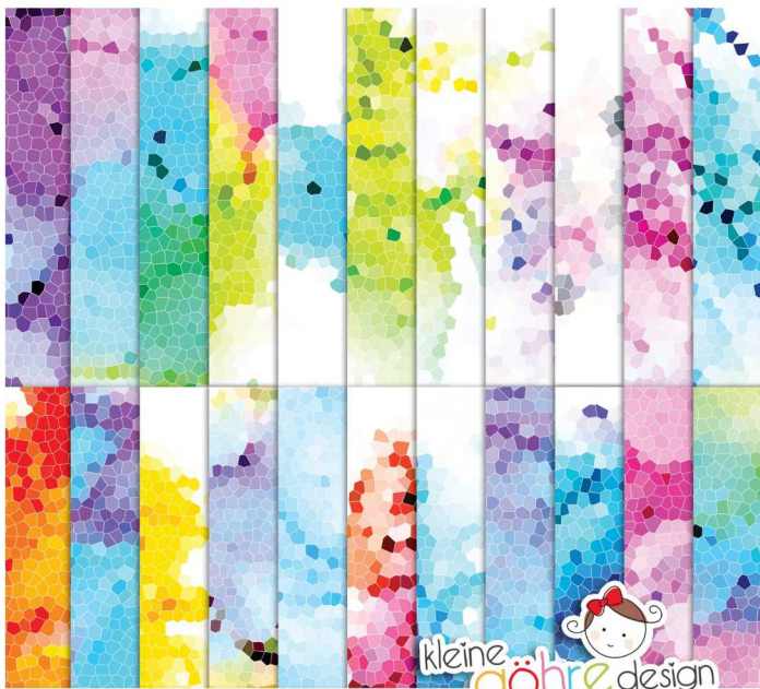
digitale Papiere "Mosaik Farbexplosion Zarter Muster3"