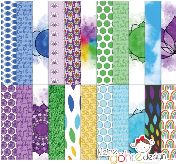
digitale Papiere "Ruhe in dir Muster1"