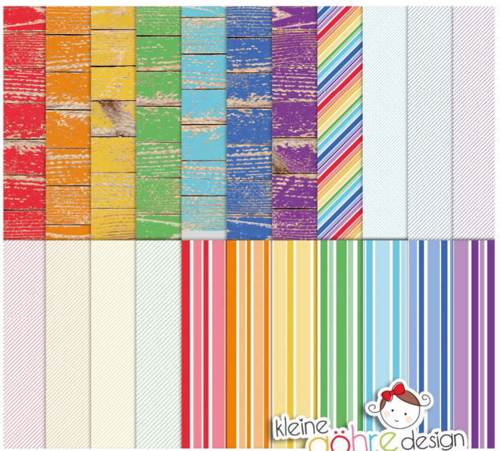
digitale Papiere "Ruhe in dir Streifen&Co"