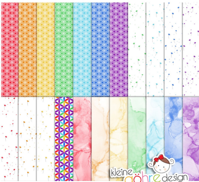
digitale Papiere "Ruhe in dir Punkte&Co"