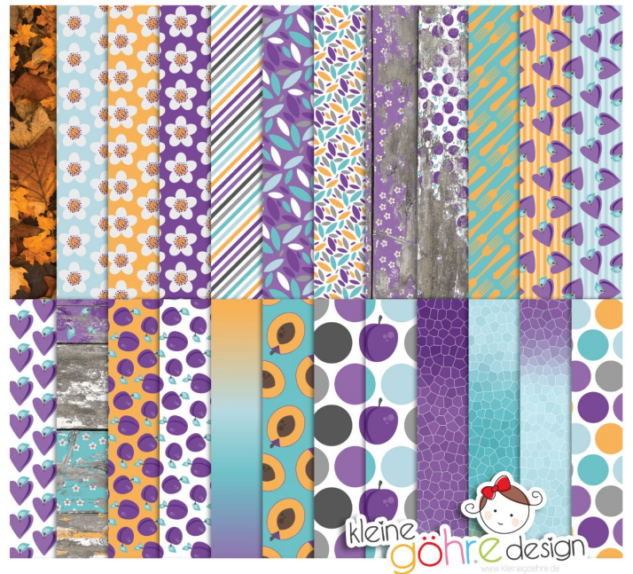
digitale Papiere "Pflaumenzeit Muster2"