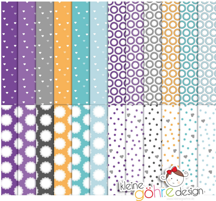
digitale Papiere "Pflaumenzeit Punkte&Co"