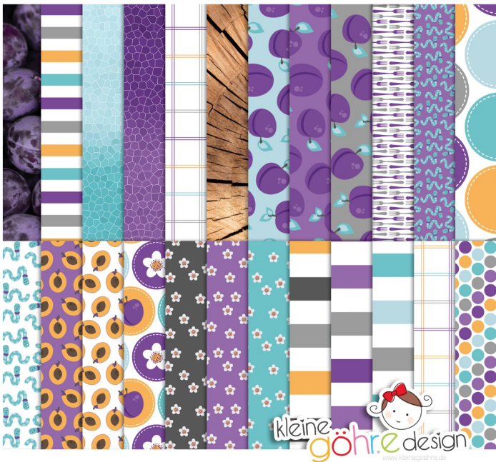
digitale Papiere "Pflaumenzeit Muster1"