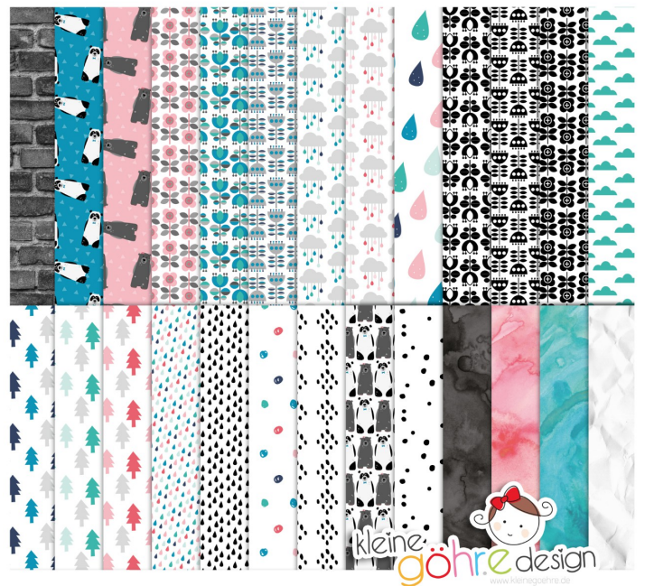
digitale Papiere "Kuschelfranz Muster2"