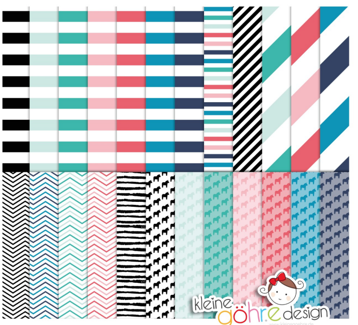
digitale Papiere "Kuschelfranz Streifen&Co"