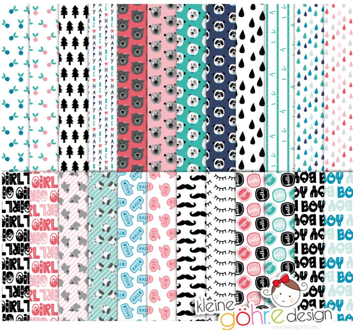
digitale Papiere "Kuschelfranz Muster1"