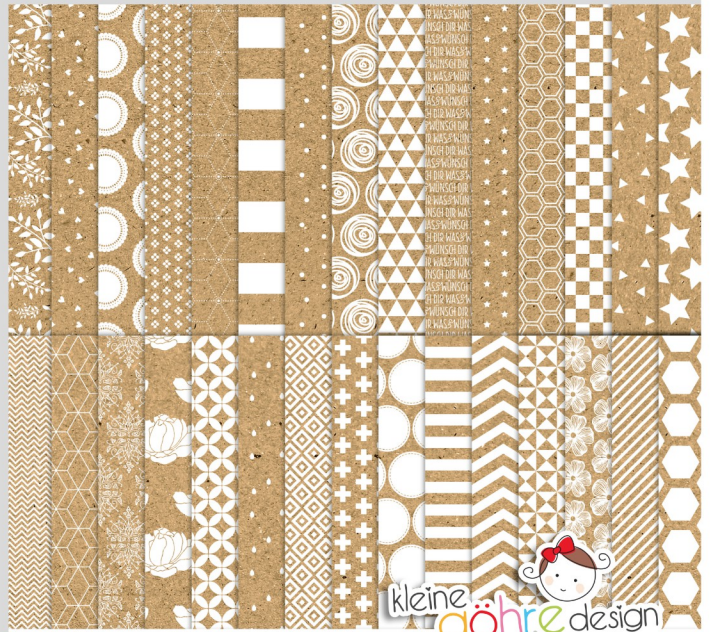
digitale Papiere "Kraftpapier weiß"