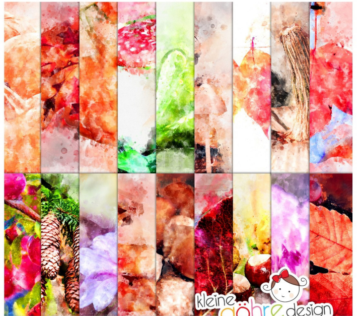
digitale Papiere "Herbstlich Muster4"