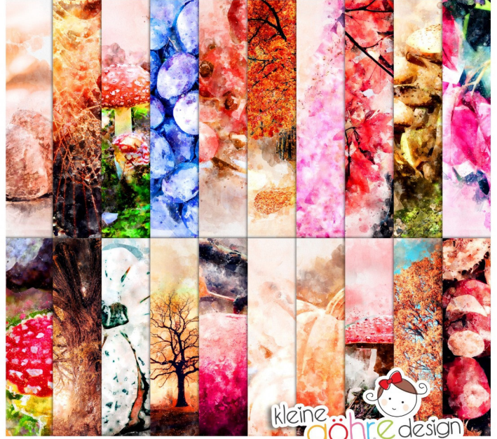
digitale Papiere "Herbstlich Muster2"