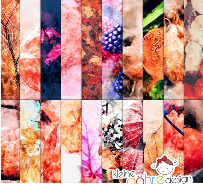
digitale Papiere "Herbstlich Muster1"