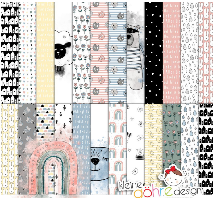
digitale Papiere "Frühlingskinder Muster1"