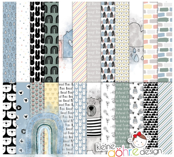
digitale Papiere "Frühlingskinder Muster2"