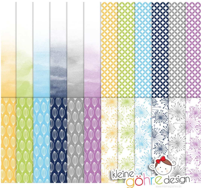
digitale Papiere "fliegende Wörter Muster3"