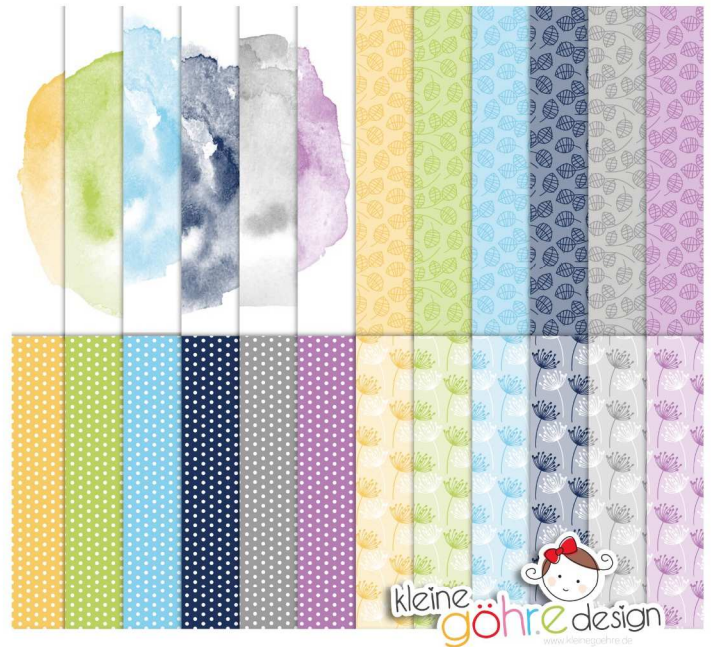
digitale Papiere "fliegende Wörter Muster2"