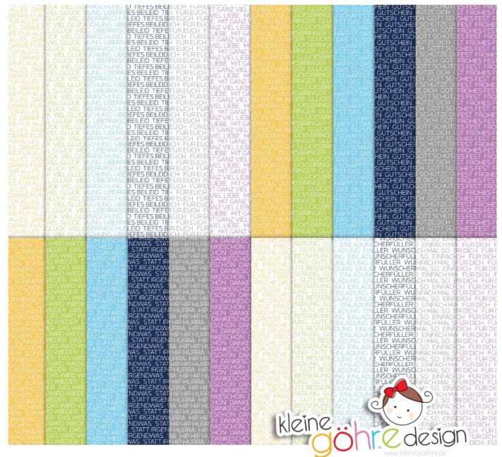
digitale Papiere "fliegende Wörter Texte"