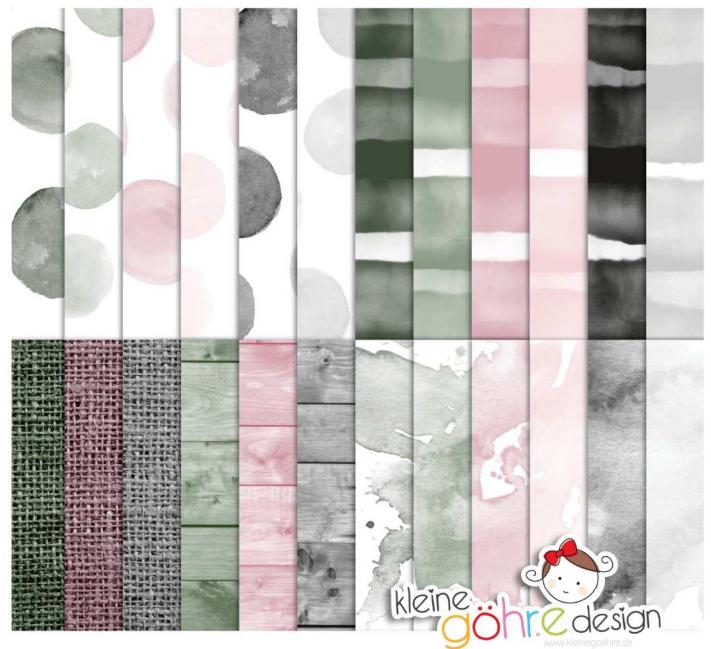
digitale Papiere "Zarte Grüße Muster 2"