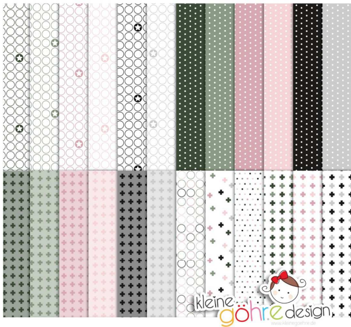
digitale Papiere "Zarte Grüße Punkte&Co"