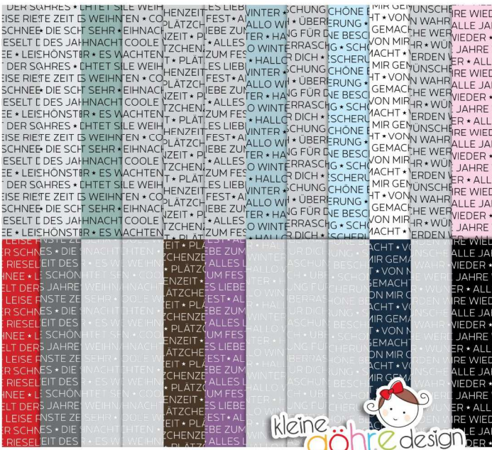
digitale Papiere "Overlays Texte Weihnachten 1"